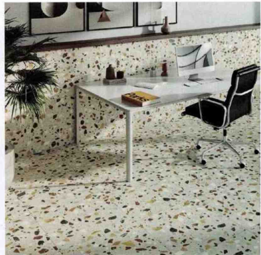
▲ Le terrazzo beige s'invite dans le bureau et grimpe même sur les murs. Un motif minéral qui dynamise les surfaces et capte la lumière. 25,94 €. Collection Terrazzo. Porcelain Superstore.

L a céramique ne se contente plus de border une crédence ou un pan de mur. En 2025, elle s'invite partout, littéralement du sol au plafond. Dans la salle de bains, elle investit les moindres recoins, recouvre les murs, encadre les miroirs, tapisse les niches. Une approche « all over » qui donne du caractère à cette pièce fonctionnelle, et évoque les hammams orientaux. Le salon n'échappe pas à cet engouement : zellige brillant sur les conduits de cheminée, faïence mate sur les murs ou encore carreaux texturés encadrant une bibliothèque. Dans la cuisine, c'est l'îlot central qui enfile le costume minéral. Une audace facilitée par l'évolution de l'industrie céramique, qui développe des formats XXL capables de créer du mobilier : plans de travail, tables, bancs monolithiques. Lisse ou craquelée, brillante ou satinée, la céramique devient un matériau d'expression à part entière, graphique et architectural.