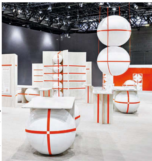
072 Première Vision Stand in Villepinte von • by Paf atelier, FR-Paris