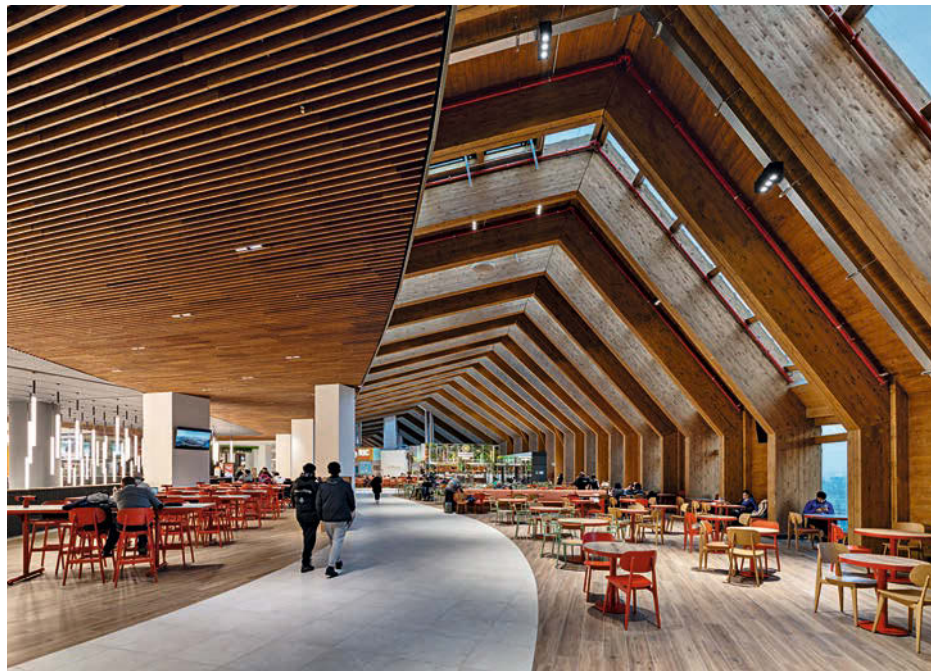
Die komplexe Holzkonstruktion steht im Vordergrund, ... • On the complex wooden construction lies the focus ...

... während sich die Linea Light-Produkte zurückhaltend einfügen. • ... while the Linea Light products blend in discreetly.