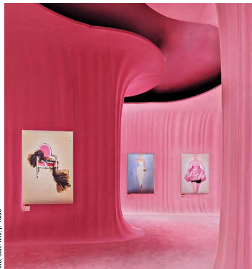
076 Ausstellung Miss Dior in Tokio von • by OMA, US-New York