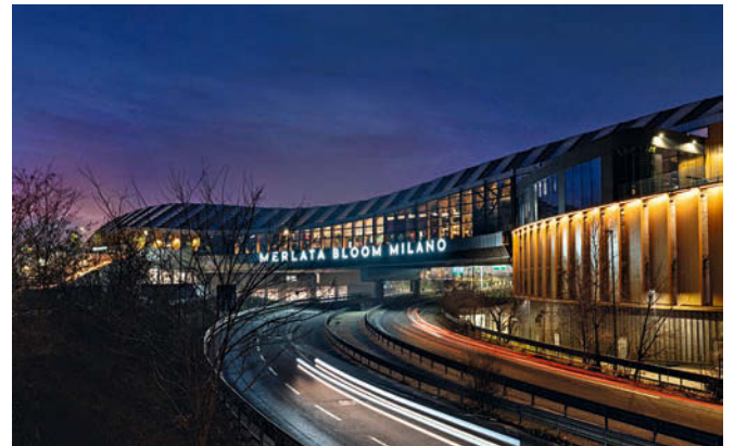
Smartes Lichtdesign ohne Blendungsgefahr • Smart light-design without a risk of glare

Entwurf • Design Studio CallisonRTKL; Studio L+DG Lighting Architects, GR-Athen