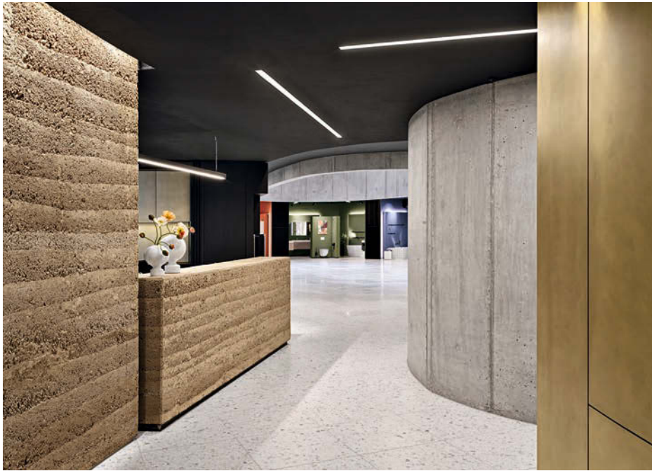
Stampflehm und Messing – zwei für Keramiken und Armaturen essenzielle ... • Rammed clay and brass – two essential materials – ...