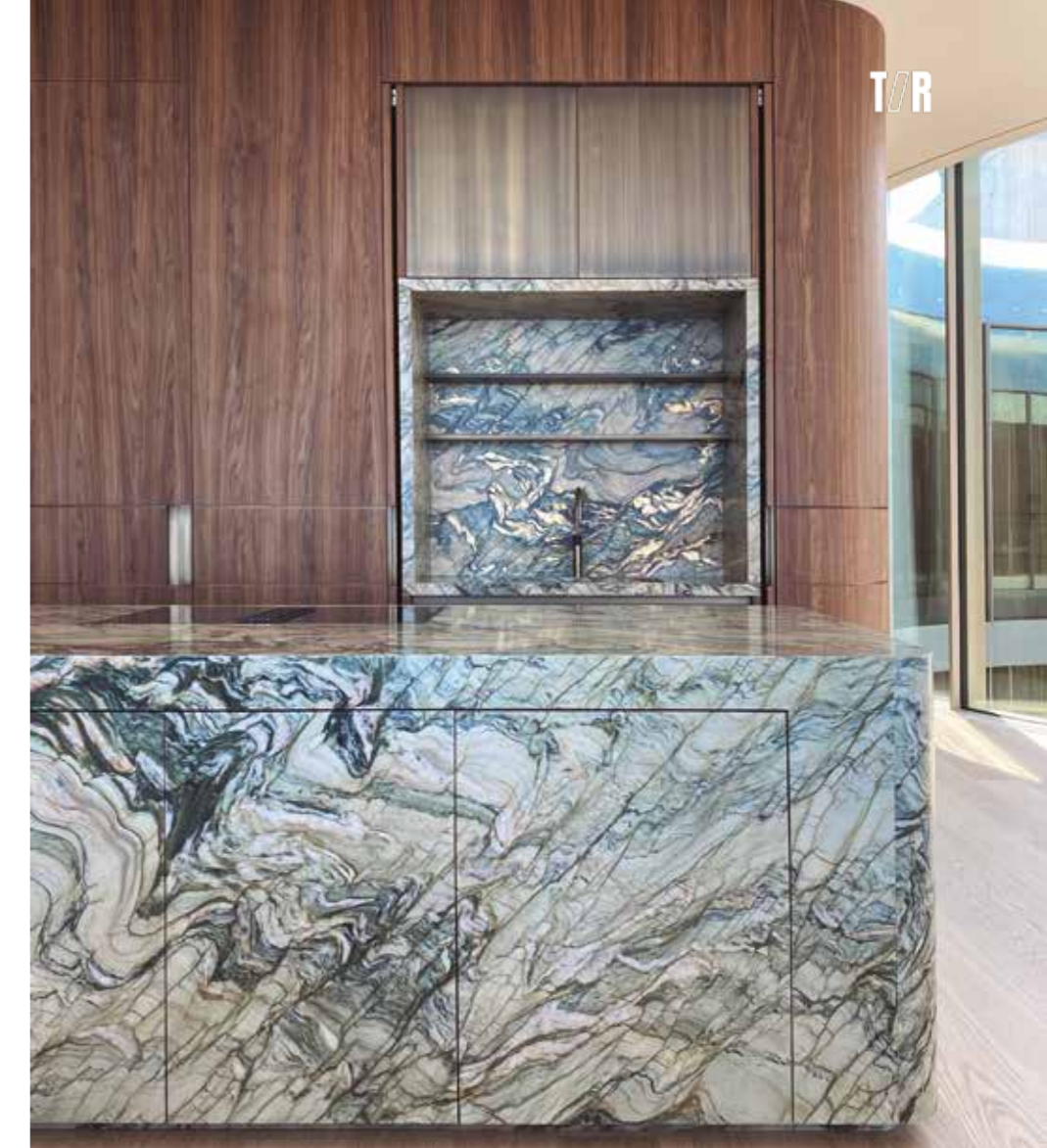
Fusion Wow Ligh. Diseño de Maison Balagan

Piedras de una belleza inigualable que satisfacen plenamente las preferencias estéticas de cada proyecto y, al mismo tiempo, ofrecen los requisitos técnicos que responden de forma eficiente a las necesidades de resistencia, inalterabilidad y durabilidad de un entorno como la cocina.