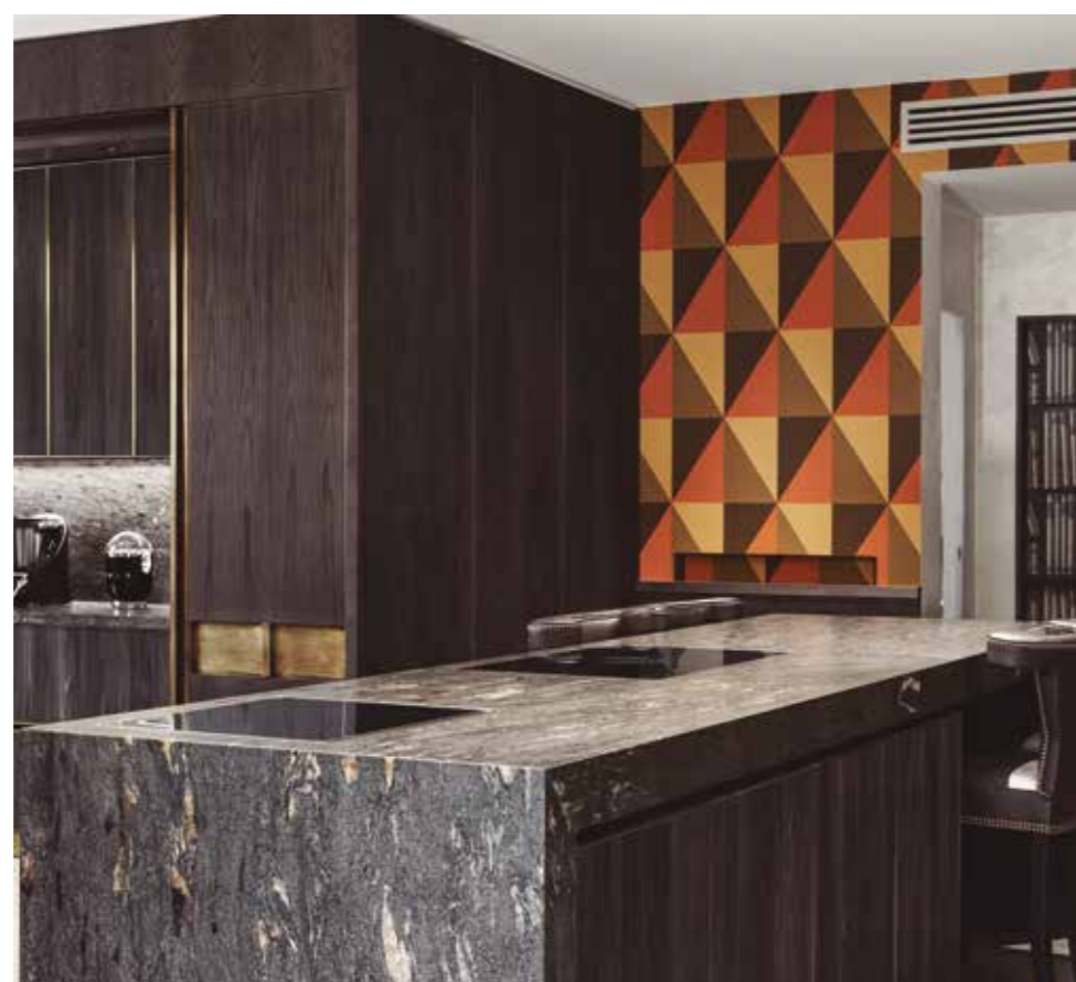
Black Cosmic. Proyecto del arquitecto Mario Santini

Con esa perspectiva puesta en las distintas identidades de la cocina contemporánea, Antolini, excelencia italiana en el mundo de las piedras naturales reconocida internacionalmente, ha desarrollado Azerocare® Plus, un proceso innovador que amplía el poder visual de sus piedras naturales protegiendo su superficie de las agresiones de los agentes externos, como las manchas y la corrosión por contacto, aunque sea breve, con sustancias orgánicas aceitosas o ácidas.