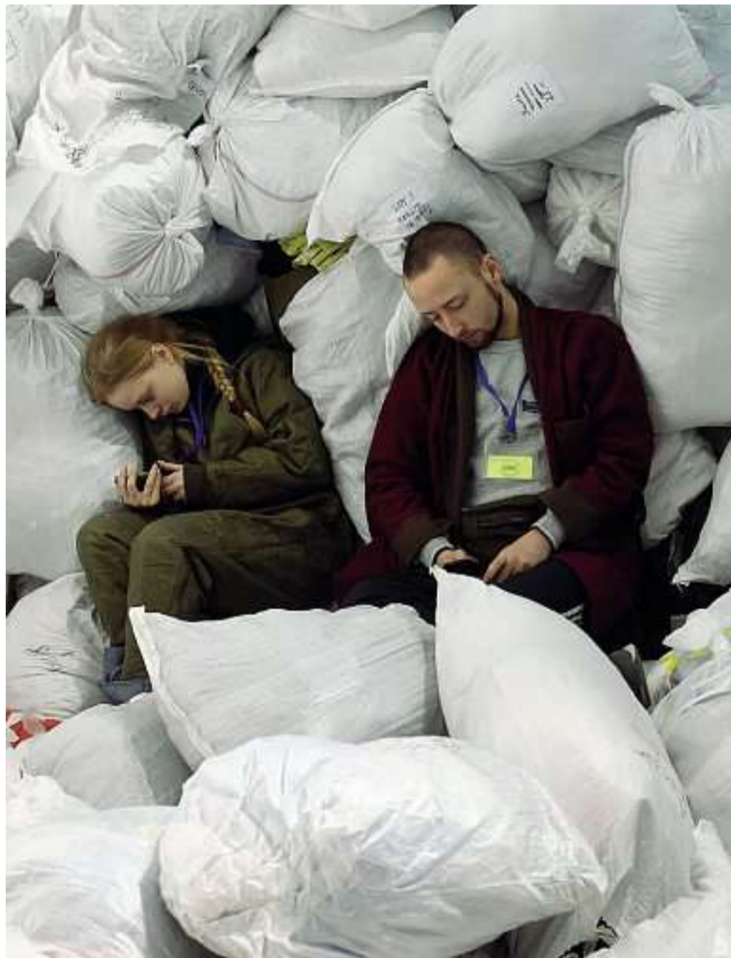
Volontari di un centro umanitario riposano tra i sacchi di vestiti donati per gli sfollati nella città di Leopoli