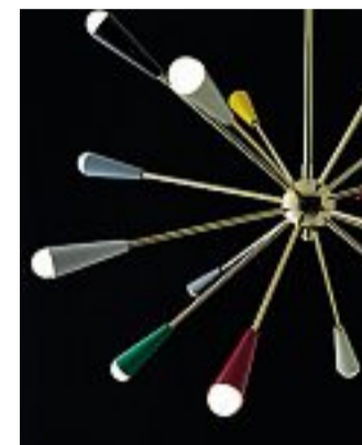
Anni '50 Lampada a sospensione Sputnik, una delle prossime riedizioni