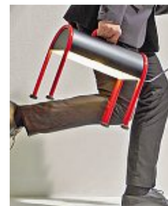
Fine anni '70 Lampada da tavolo Valigia di Ettore Sottsass