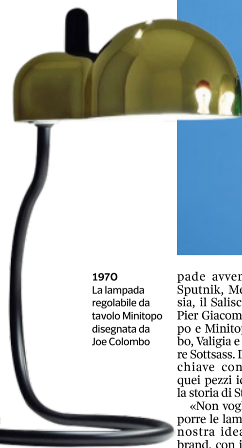
1970 La lampada regolabile da tavolo Minitopo disegnata da Joe Colombo

pade avveniristiche come Sputnik, Megafono e Galassia, il Saliscendi di Achille e Pier Giacomo Castiglioni, Topo e Minitopo di Joe Colombo, Valigia e Campana di Ettore Sottsass. Dalla riedizione in chiave contemporanea di quei pezzi iconici ricomincia la storia di Stilnovo.